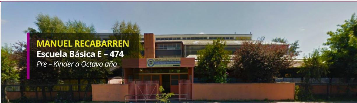
MANUEL RECABARREN Escuela Básica E - 474 Pre - Kinder a Octavo año